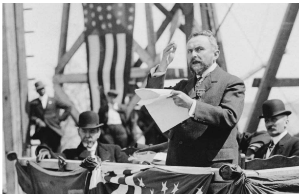
Etats-Unis. 3 mai 1912. Gabriel Hanotaux conduit la mission Champlain.

Chartiste puis maître de conférences à l'École pratique des hautes études, Gabriel Hanotaux (1853-1944) est entré au Quai d'Orsay comme lecteur des Archives diplomatiques dans le cadre de ses recherches sur Richelieu. Une fois intégré au ministère, il en a gravi les échelons, passant par trois cabinets ministériels dont celui de Gambetta (1881-1882) et de Jules Ferry (1883-1885), avant une unique expérience en poste à Constantinople (1885-1886).