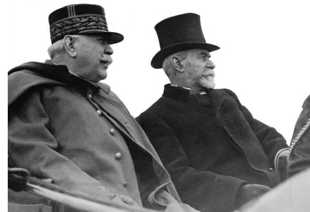
Etats-Unis. 26 avril 1917. Le maréchal Joffre et Jules Jusserand, ambassadeur de France à Washington.

A partir de 1881, il fait surtout carrière à l'administration centrale, à la direction des Affaires politiques, tout en poursuivant sa vocation littéraire. Il s'implique dans l'organisation du protectorat en Tunisie où il seconde son ami Paul Cambon (1882-1887), est nommé à la tête de la légation de Copenhague (1898) avant de succéder à Jules Cambon comme ambassadeur à Washington. Son ambassade est exceptionnelle à plus d'un titre : par sa longueur (vingt-trois ans), par l'estime et l'amitié qui lient l'ambassadeur au Président Théodore Roosevelt, par la popularité dont il jouit auprès des Américains, par les succès de son action diplomatique. L'appui des États-Unis lors de la crise marocaine et de la conférence d'Algésiras et l'entrée en guerre des États-Unis en 1917 sont à porter à son crédit. Jules Jusserand incarne un modèle de diplomate parfaitement acclimaté à son pays de résidence selon le principe qu'il est désormais moins important de persuader un prince et son ministre que de comprendre une nation .